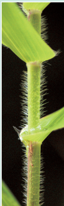
Tige et feuilles avec des bases en forme de cœur